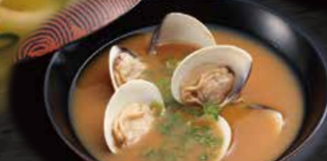
あさりのお味噌汁 150円