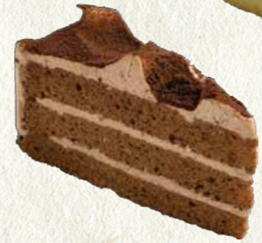
生チョコレートケーキ 300円