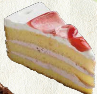
いちごショート ケーキ 300円