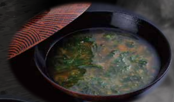
あおさのお味噌汁 150円