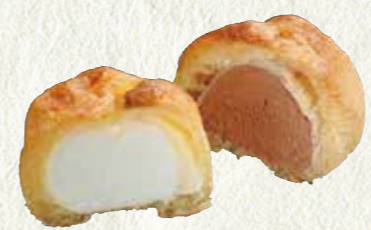
シューアイス (バニラ・チョコセット) 150円