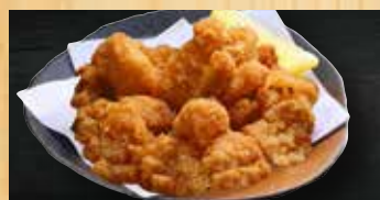
軟骨の唐揚げ 400円+税