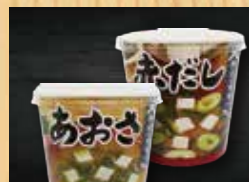
カップ味噌汁 180円+税