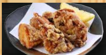
鶏の唐揚げ(6個) 400円+税