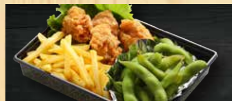
ミニオードブル 530円+税 鶏の唐揚げ、フライドポテト、枝豆