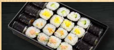
細巻きセット 550円+税 かっぱ巻き、しんこ巻き、納豆巻き、ねぎとろ巻き