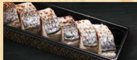
焼き鯖押し寿司 500円+税