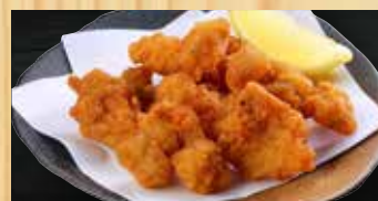
もつの唐揚げ 400円+税