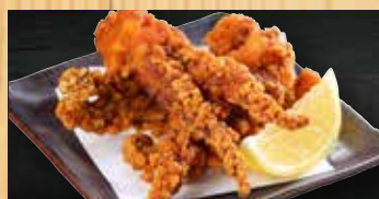
げその唐揚げ 400円+税