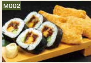
M002 助六 650円