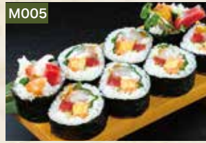
M005 海鮮巻 2,380円