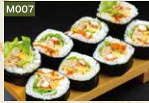
M007 かにサラダ巻 1,300円