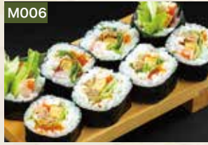
M006 えびサラダ巻 1,190円