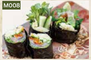
M008 あじのガリ巻 870円