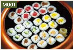
M001 細巻き尽くし 940円