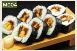
M004 巻寿司 700円