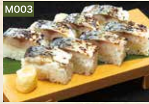
M003 焼き鯖押し寿司 870円