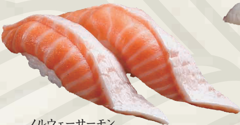
ノルウェーサーモン