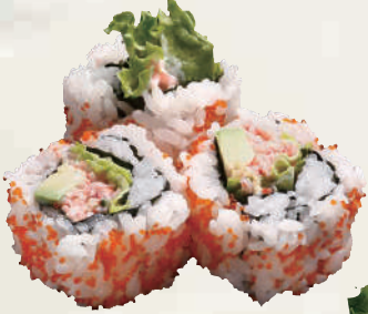
カリフォルニアロール