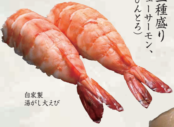
自家製湯がし大えび