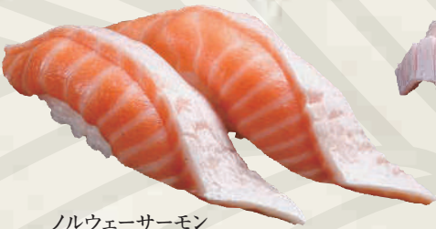
ノルウェーサーモン