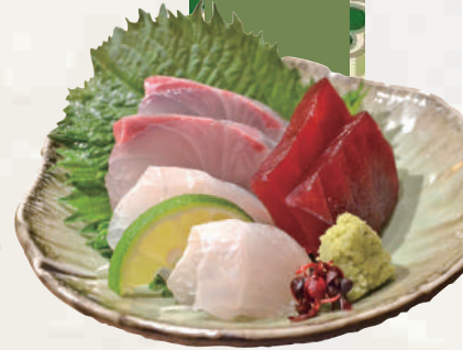
本日のお造り三点盛り (イメージ)