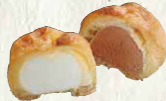
シューアイス (バニラ・チョコセット) 150円