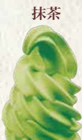
ソフトクリーム 各種 250円