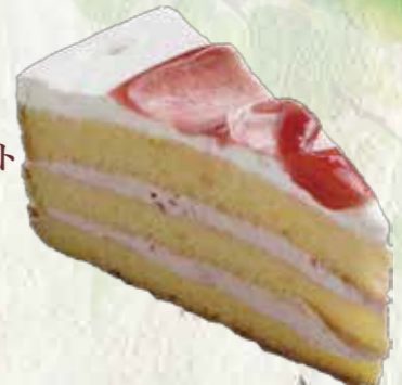
いちごショート ケーキ 300円