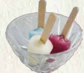
ミニアイスクャンディー (バニラ・グレープ・ソーダのセット) 100円