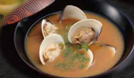
あさりのお味噌汁 150円