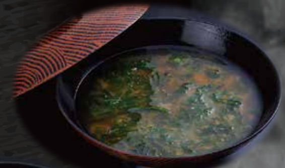
あおさのお味噌汁 150円