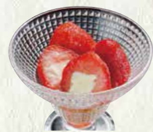
フローズン いちごミルク 200円