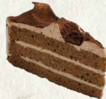
生チョコレートケーキ 300円