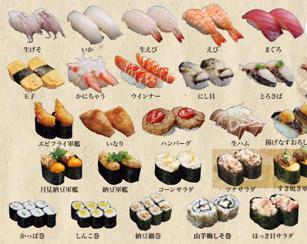
生げそ、いか、生えび、えび、まぐろ、 玉子、かにちやう、ウイナー、にし貝、とろさば、 サーモン焼きハラス、 エビフライ軍艦、いなり、ハンバーグ、生ハム、揚げなすおろしポン酢、 月見納豆軍艦、納豆軍艦、コーンサラダ、ツナサラダ、すき焼き軍艦、 かつば巻、しんこ巻、納豆細巻、山芋梅しそ巻、ほっき貝サラダ、カニ風味サラダ