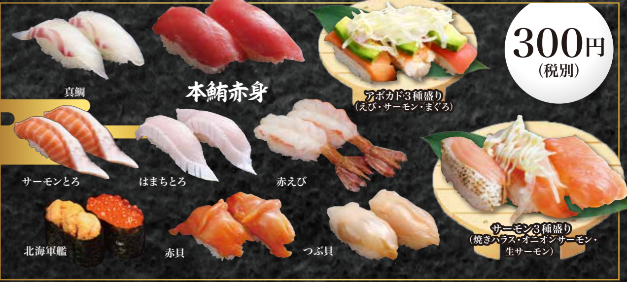
真鯛、本鮭赤身、アボカド3種盛り(えび・サーモン・まぐろ)、 サーモンとろ、はまちとろ、赤えび、 北海軍艦、赤貝、つぶ貝、 サーモン3種盛り(焼きハラス・オニオンサーモン・生サーモン)