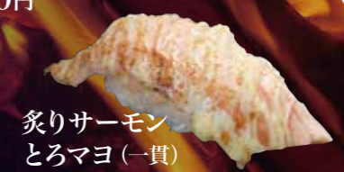
炙りサーモン とろマヨ(一貫) 150円