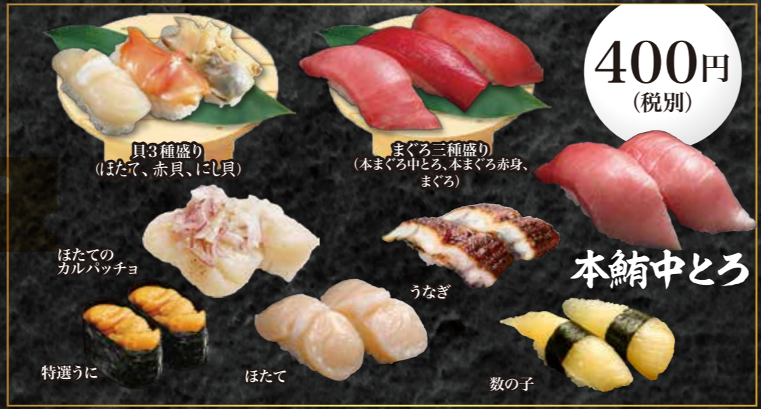
貝3種盛り(ほたて、赤貝、にし貝)、まぐろ3種盛り(本まぐろ中とろ、本まぐろ赤身、まぐろ)、 ほたてのカルパッチョ、うなぎ、 特選うに、ほたて、数の子