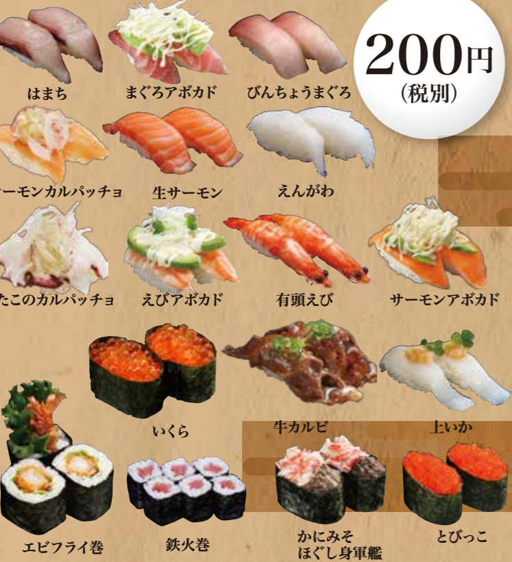
はまち、まぐろアボカド、びんちょうまぐろ、 サーモンカルパッチョ、生サーモン、えんがわ、 たこのカルパッチョ、えびアボカド、有頭えび、サーモンアボカド、 いくら、牛カルビ、上いか、 エビフライ巻、鉄火巻、かにみそほぐし身軍艦、とびっこ