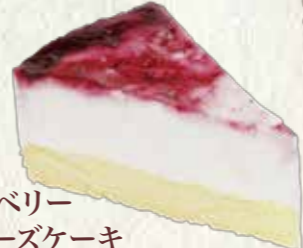
ブルーベリー レアチーズケーキ 200円