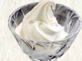
ソフトクリーム〈グラス〉 150円