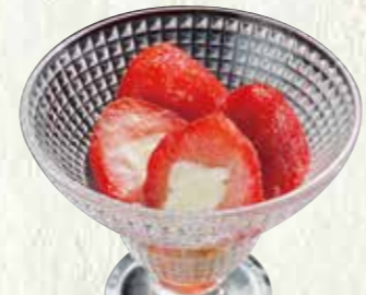
フローズン いちごミルク 200円