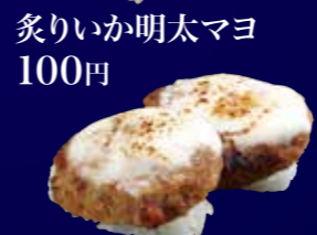
炙りいか明太マヨ 100円