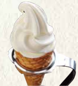
ソフトクリーム〈コーン〉 200円