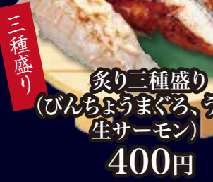
炙り三種盛り (びんちょうまぐろ、うなぎ、 生サーモン) 400円