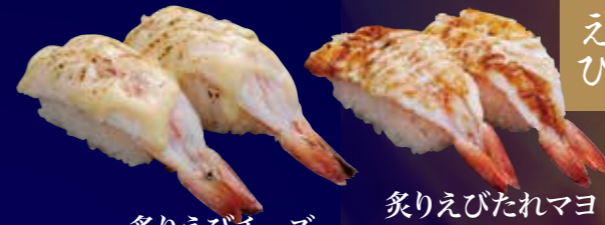
炙りえびたれマヨ 100円