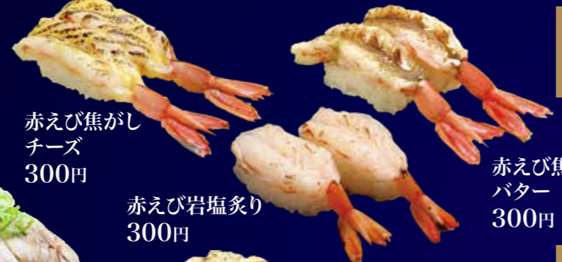
赤えび焦がし バター 300円