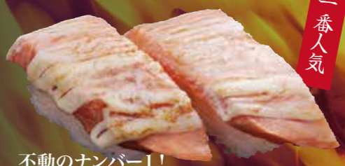
不動のナンバー1! 炙りサーモンマヨ 150円