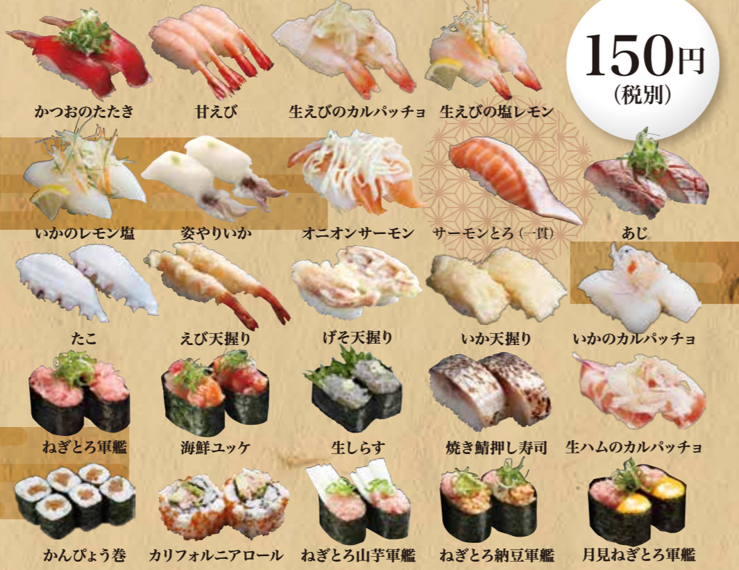
かつおのたたき、甘えび、生えびのカルパッチョ、生えびの塩レモン、 いかのレモン塩、姿やりいか、オニオンサーモン、サーモンとろ(一貫)、あじ、 たこ、えび天握り、げそ天握り、いか天握り、いかのカルパッチョ、 ねぎとろ軍艦、海鮮ユッケ、生しらす、焼き鯖押し寿司、生ハムのカルパッチョ、 かんぴょう巻、カリフォルニアロール、ねぎとろ山芋軍艦、ねぎとろ納豆軍艦、月見ねぎとろ軍艦