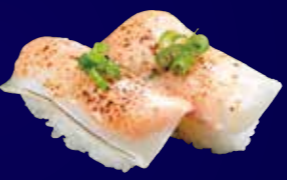
炙りえびチーズ 150円