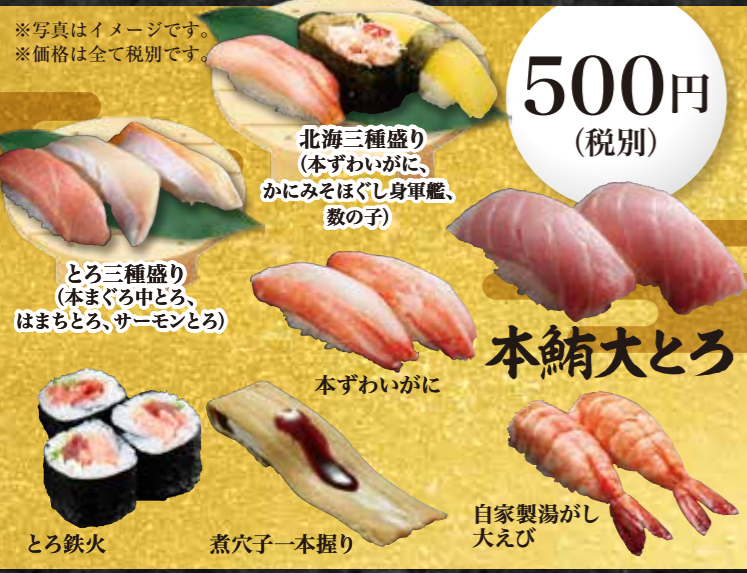
※写真はイメージです。 ※価格は全て税別です。 北海三種盛り(本ずわいがに、かにみそほぐし身軍艦、数の子)、 とろ三種盛り(本まぐろ中とろ、はまちとろ、サーモンとろ)、 本ずわいがに、 とろ鉄火、煮穴子一本握り、自家製湯がし大えび