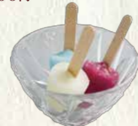
ミニアイスクャンディー (バニラ・グレープ・ソーダのセット) 100円