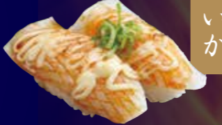
炙りいかたれマヨ 100円