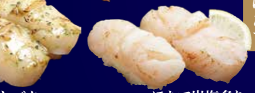
ほたて岩塩炙り 400円