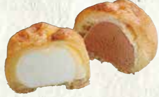
シューアイス (バニラ・チョコセット) 150円