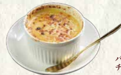
アイスクリームブリュレ 200円