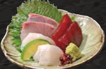
本日のお造り三点盛り 500円