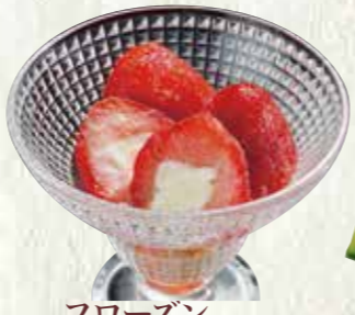
フローズンいちごミルク 200円