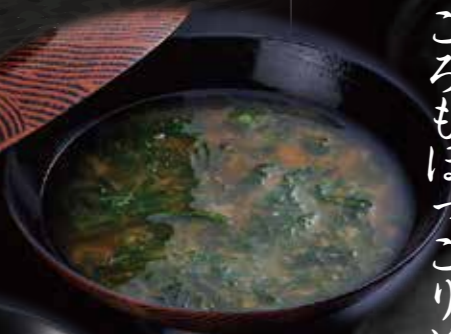
あおさのお味噌汁 150円