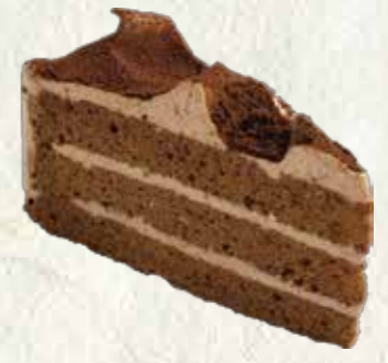
生チョコレートケーキ 300円