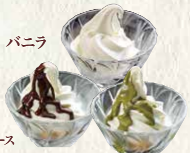
濃厚ソフトクリーム〈グラス〉 150円