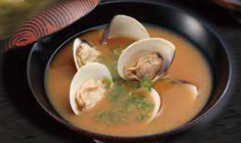
あさりのお味噌汁 150円