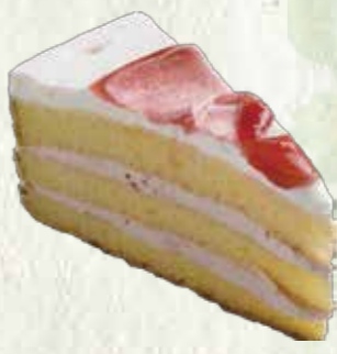
いちごショートケーキ 300円