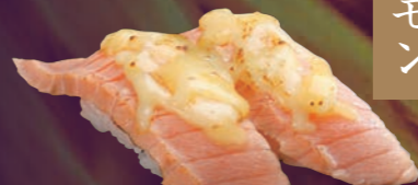
炙りサーモンチーズ 150円