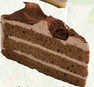
生チョコレートケーキ 280円