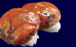
炙りハンバーグカレー 100円