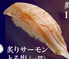
炙りサーモンとろ塩 (一貫) 100円