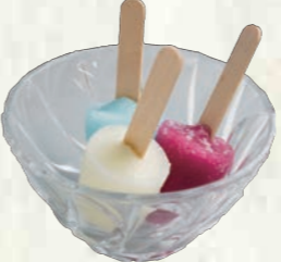
ミニアイスクャンディー (バニラ・グレープ・ソーダのセット) 100円