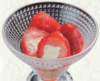
フローズンいちごミルク 200円