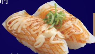
炙りいかたれマヨ 100円