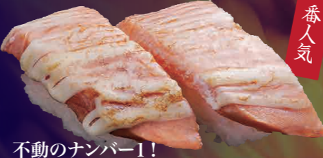
不動のナンバー1! 炙りサーモンマヨ 150円