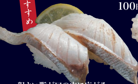
程よい脂が口の中に広がる 炙りはまち塩 200円