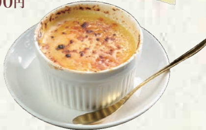
アイスクリームブリュレ 200円