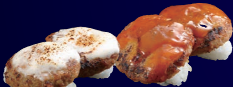
炙りハンバーグチーズ 100円