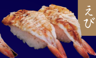
炙りえびたれマヨ 100円