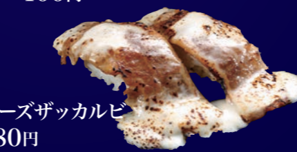
チーズザッカルビ 280円