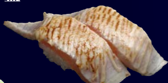
炙りびんとろマヨ 200円