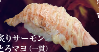
炙りサーモンとろマヨ (一貫) 100円