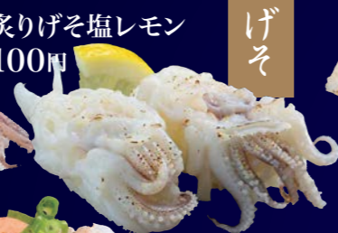
炙りげそ塩レモン 100円