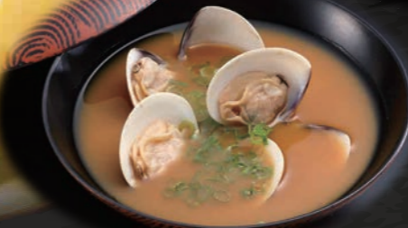
あさりのお味噌汁 150円