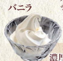
濃厚ソフトクリーム(グラス) 150円