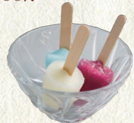
ミニアイスキャンディー (バニラ・グレープ・ソーダのセット) 100円