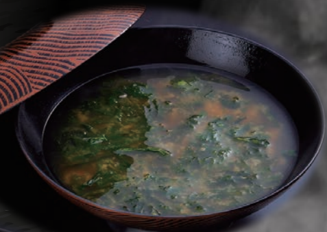
あおさのお味噌汁 150円