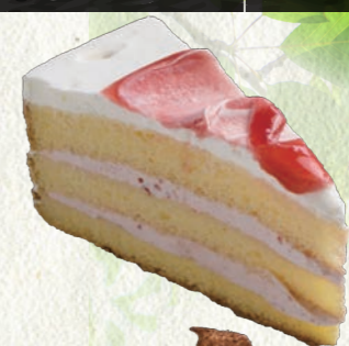
いちごショートケーキ 280円