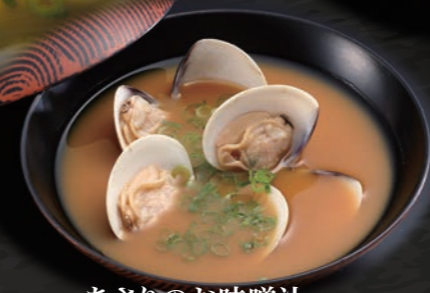
あさりのお味噌汁 150円