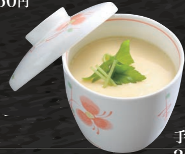
手作り茶碗蒸し 200円