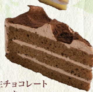
生チョコレートケーキ 280円