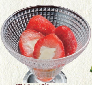
フロズンいちごミルク 200円