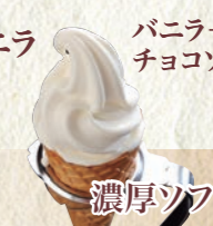
濃厚ソフトクリーム(コーン) 200円