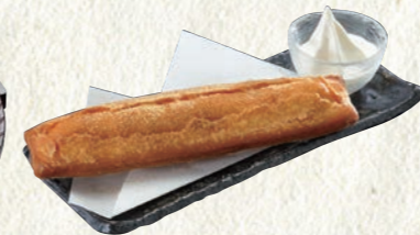
きな粉パン 〜ソフトクリーム添え〜 280円