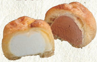
シューアイス (バニラ・チョコセット) 150円