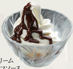
濃厚ソフトクリーム バナラ+チョコソース