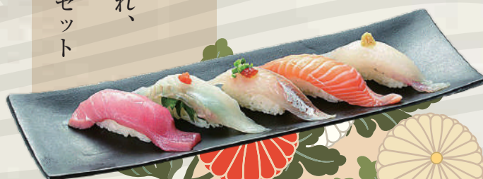
鮮魚五種盛り(イメージ)