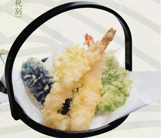
天ぷら盛り合わせ