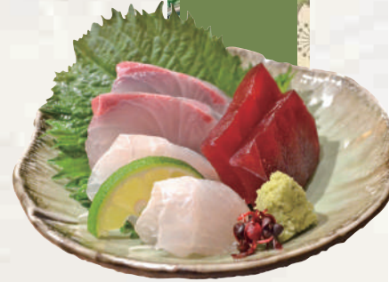
本日のお造り三点盛り (イメージ)