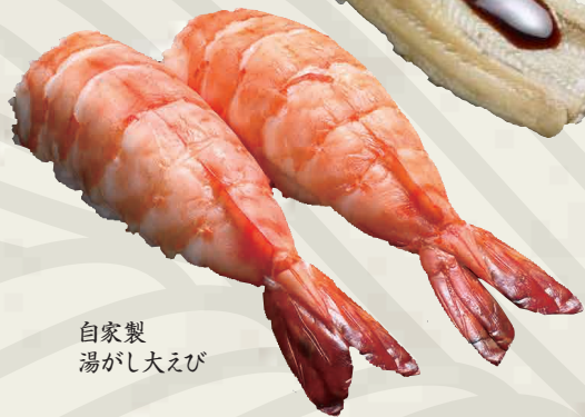
自家製 湯がし大えび