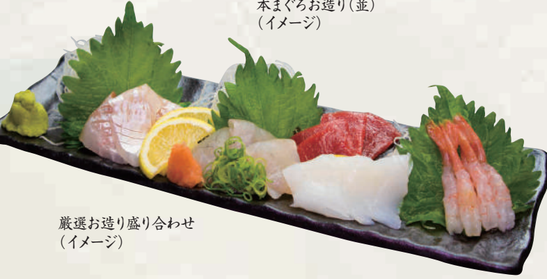
厳選お造り盛り合わせ (イメージ)