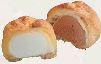
シューアイス (バナラ・チョコ)