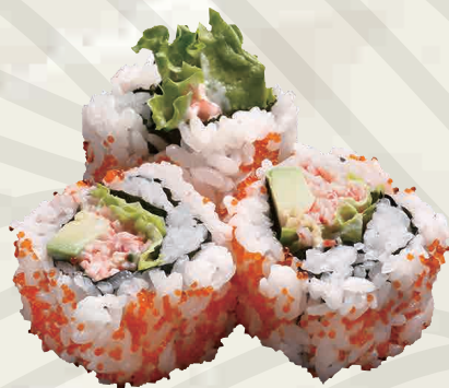
カリフォルニアロール