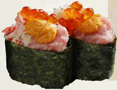
贅沢軍艦 うに、いくら、カニのほぐし身、 ねぎとろが入った 贅沢な軍艦!