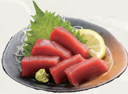
本まぐろお造り(並) (イメージ)