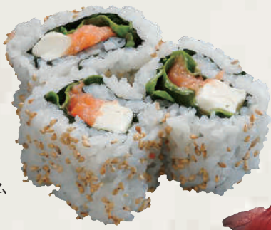
サーモンクリーム チーズロール