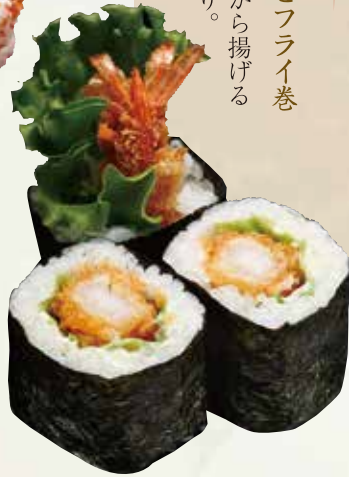
カリフォルニアロール