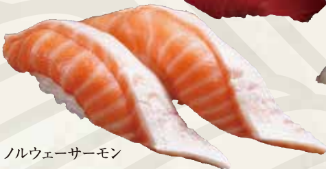
ノルウェーサーモン