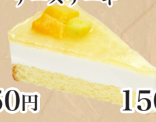
マンゴーレア チーズケーキ