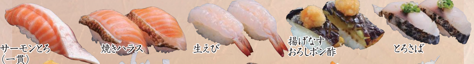
サーモンとろ (一貫)