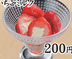
フロースン いちごミルク