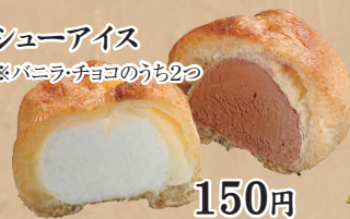
シューアイス ※バニラ・チョコのうち2つ