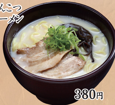
とんこつ ラーメン