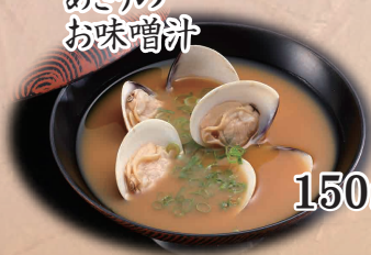
あさりの お味噌汁