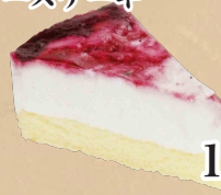
ブルーベリーレア チーズケーキ