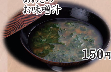
あおさの お味噌汁