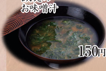
あおさの お味噌汁