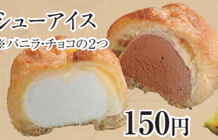
シューアイス ※バニラ・チョコの2つ