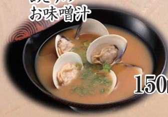
あさりの お味噌汁