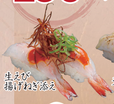
生えび 揚げねぎ添え