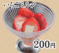
フローズン いちごミルク