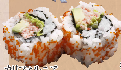
カリフォルニア ロール