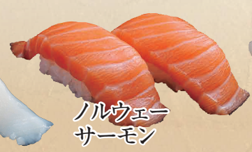
ノルウェー サーモン