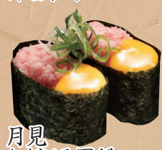
月見 ねぎとろ軍艦