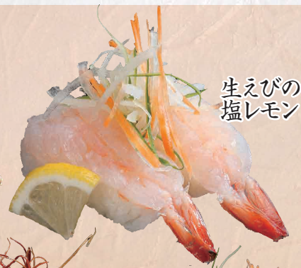
生えびの 塩レモン