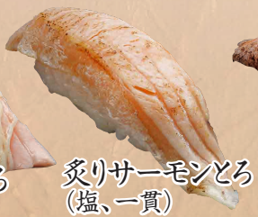
炙りサーモンとろ (塩、一貫)