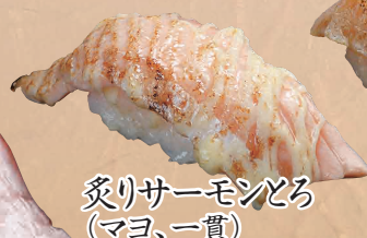
炙りサーモンとろ (マヨ、一貫)