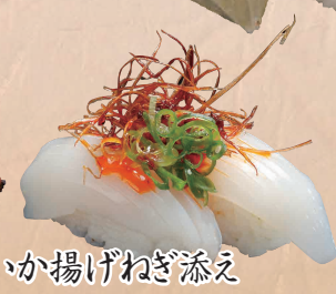
いか揚げねぎ添え