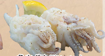
炙りげそ(塩レモン)