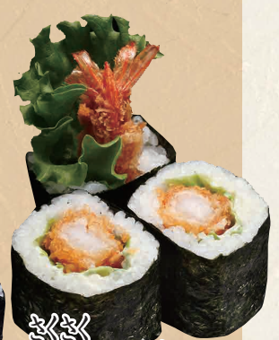
きんぎょ エビフライ巻