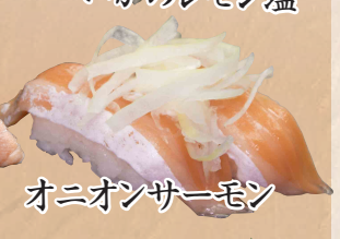
オニオンサーモン