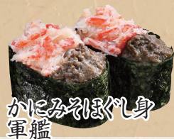
かにみそほぐし 軍艦