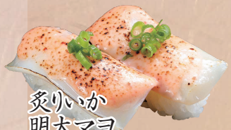
炙りいか 明太マヨ