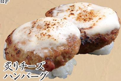
炙りチーズ ハンバーグ