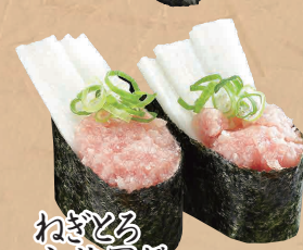
ねぎとろ 山芋軍艦