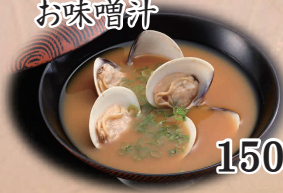
あさりの お味噌汁