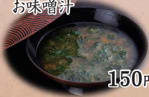
あおさの お味噌汁