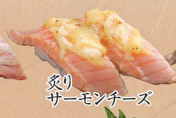
炙り サーモンチーズ