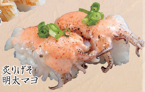
炙りげそ 明太マヨ