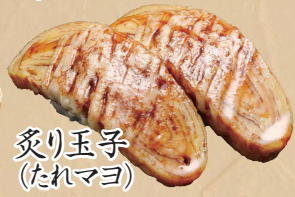
炙り玉子 (たれマヨ)