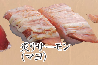
炙りサーモン (マヨ)