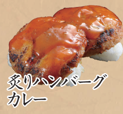
炙りハンバーグ カレー