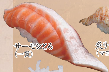
サーモンとろ (一貫)