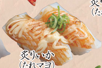
炙りいか (たれマヨ)