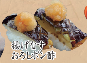
揚げなす おろしポン酢