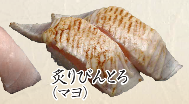
炙りびんとろ (マヨ)