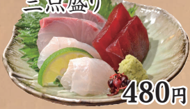
本日のお造り 三点盛り