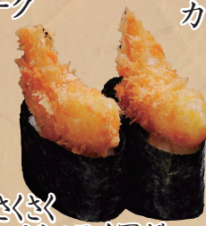
さくさく エビフライ軍艦