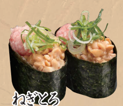
ねぎとろ 納豆軍艦