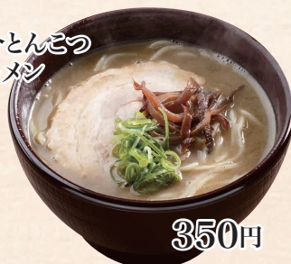
魚介とんこつ ラーメン