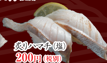
炙りハマチ(塩) 200円(税別)