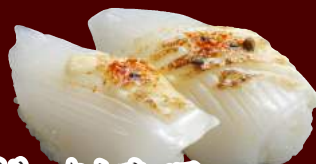
炙りいか七味マヨ 100円(税別)