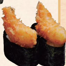
さくさくエビフライ軍艦