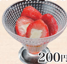
フローズンいちごミルク