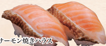
サーモン焼きハラス