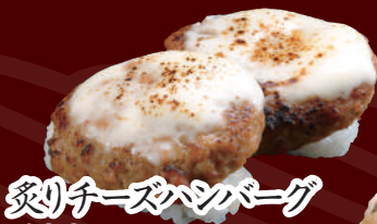
炙りチーズハンバーグ 100円(税別)