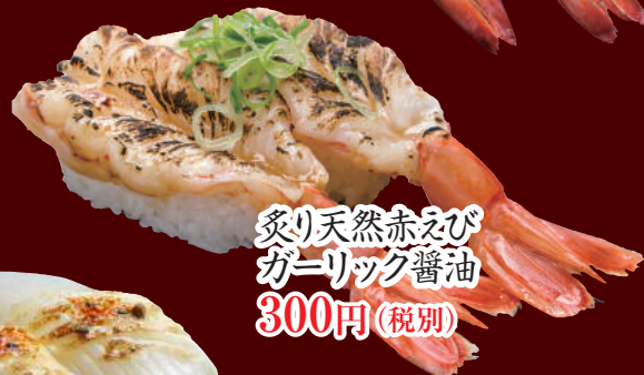
炙り天然赤えび ガーリック醤油 300円(税別)