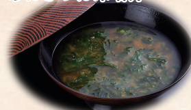
あおさのお味噌汁