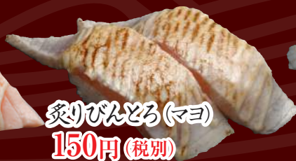
炙りびんとろ(マヨ) 150円(税別)