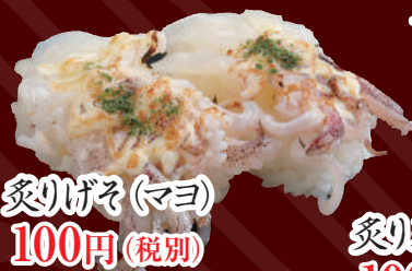
炙りげそ(マヨ) 100円(税別)