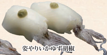
姿やりのいかゆず胡椒