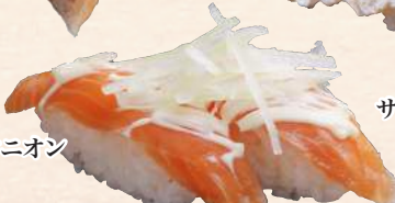
サーモンオニオン