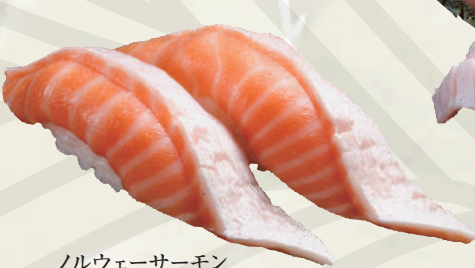
ノルウェーサーモン