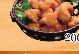
コリコリ軟骨から揚げ