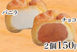
シューアイス (2個お選びください)