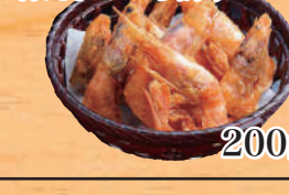
甘えびのから揚げ