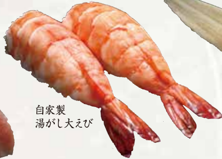
自家製湯がし大えび