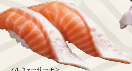
ノルウェーサーモン