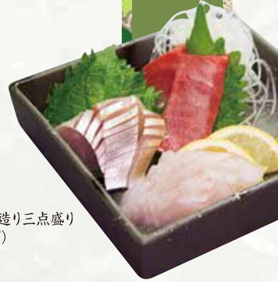
本日のお造り三点盛り (イメージ)