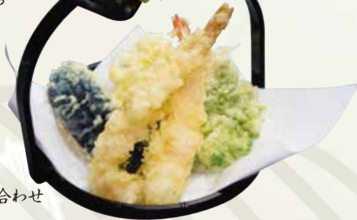
天ぷら盛り合わせ