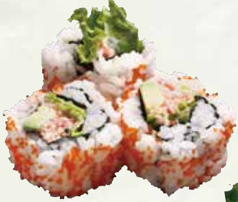
カリフォルニアロール