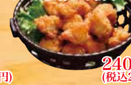
コリコリ軟骨から揚げ