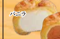
シューアイス (2個お選びください)