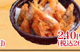
甘えびのから揚げ