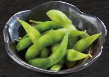
枝豆 150円 (税込165円)