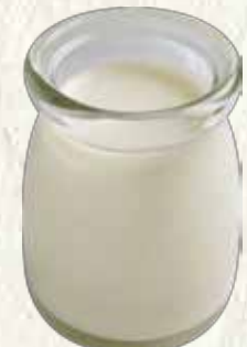
濃厚杏仁 150円 (税込165円)