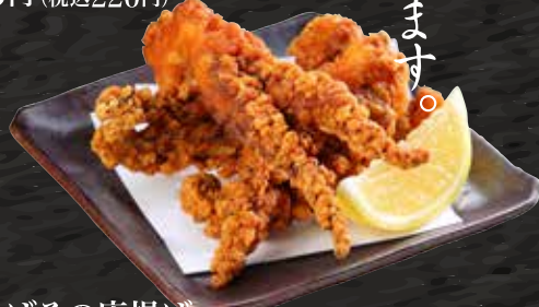
げその唐揚げ 200円 (税込220円)