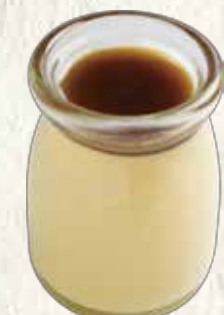
濃厚プリン 150円 (税込165円)