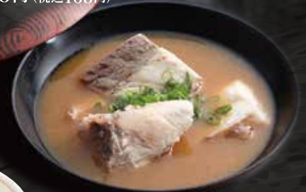
あら汁 200円 (税込220円)