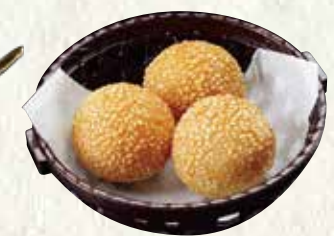
ごま団子 150円 (税込165円)