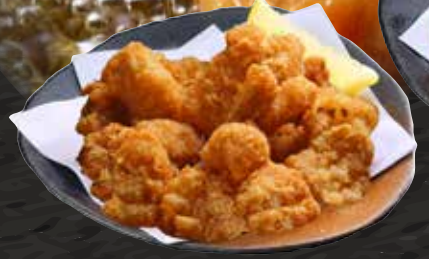
もつの唐揚げ 200円 (税込220円)