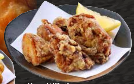
鶏の唐揚げ 200円 (税込220円)