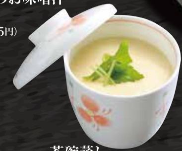
茶碗蒸し 200円 (税込220円)