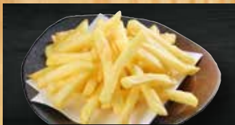
ポテトフライ 200円+税