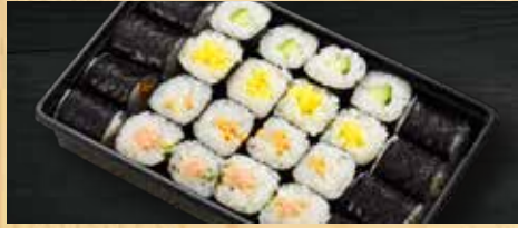
細巻きセット 550円+税 かつば巻き、しんこ巻き、納豆巻き、ねぎとろ巻き