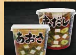
カップ味噌汁 180円+税