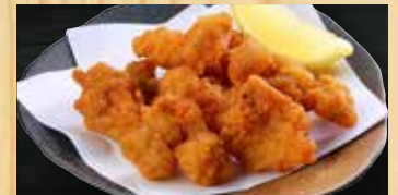
もつの唐揚げ 400円+税