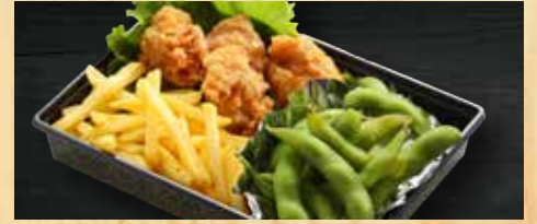
ミニオードブル 530円+税 鶏の唐揚げ、フライドポテト、枝豆