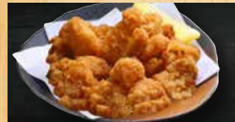
軟骨の唐揚げ 400円+税