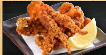
げその唐揚げ 400円+税