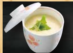
手作り茶碗蒸し 300円+税