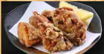
鶏の唐揚げ(6個) 400円+税