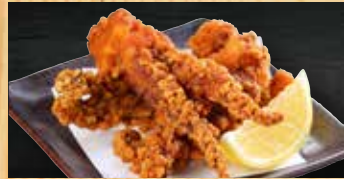
げその唐揚げ 400円+税