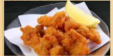
もつの唐揚げ 400円+税