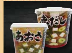
カップ味噌汁 180円+税