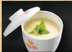
手作り茶碗蒸し 300円+税