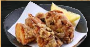
鶏の唐揚げ(6個) 400円+税