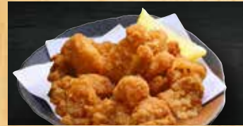
軟骨の唐揚げ 400円+税