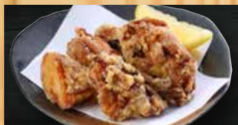
鶏の唐揚げ(6個) 400円+税