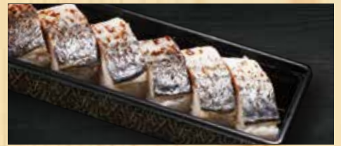
焼き鯖押し寿司 500円+税