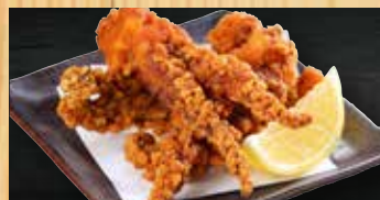
げその唐揚げ 400円+税