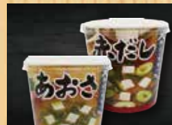
カップ味噌汁 180円+税