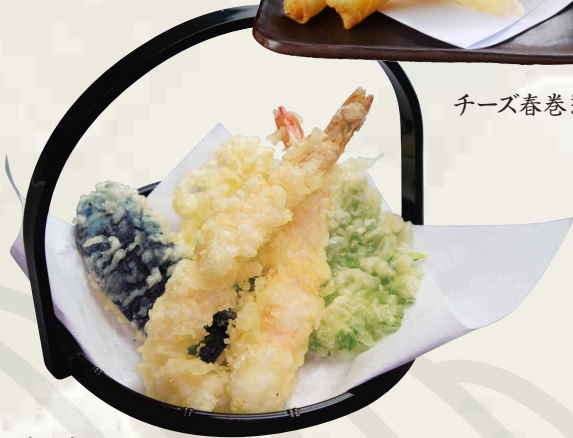
天ぷら盛り合わせ