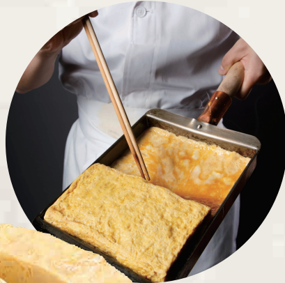
独自の出汁で 仕上げた 自家製だし巻き