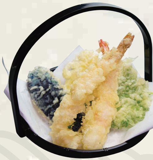
天ぷら盛り合わせ