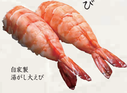
自家製湯がし大えび