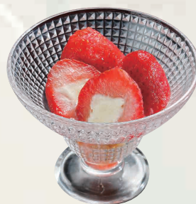
いちごミルクアイス