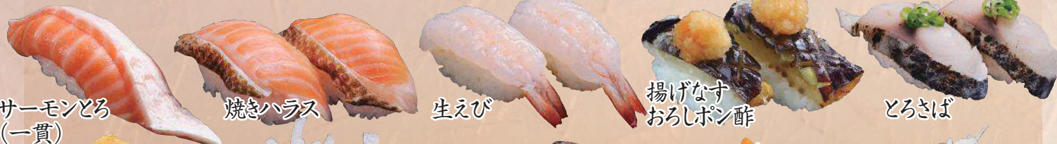
サーモンとろ (一貫)