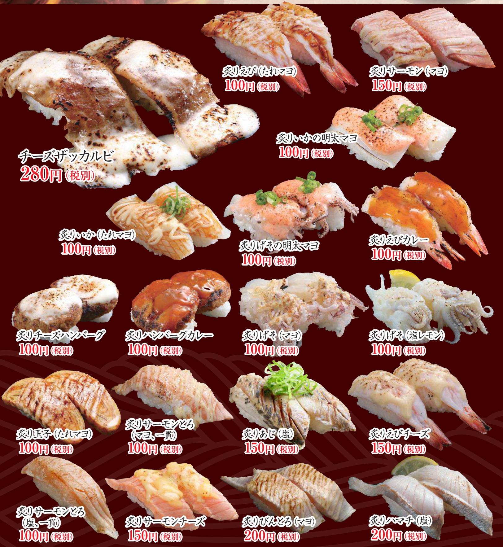
チーズザッカルビ 280円 (税別)