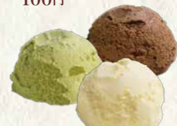
アイスクリーム各種 (バニラ、チョコレート、抹茶の 中からお選びください。) 150円