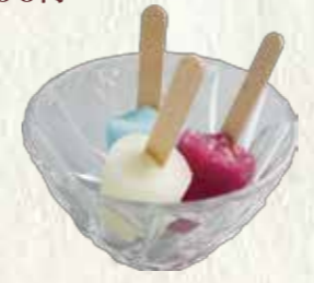
ミニアイスクャンディー (バニラ・グレープ・ソーダのセット) 100円