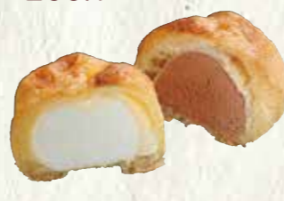
シューアイス (バニラ・チョコセット) 150円