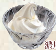
濃厚ソフトクリーム〈グラス〉150円