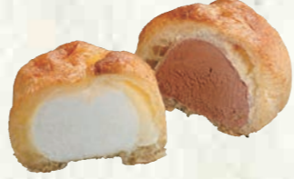
シューアイス (バニラ・チョコセット) 150円