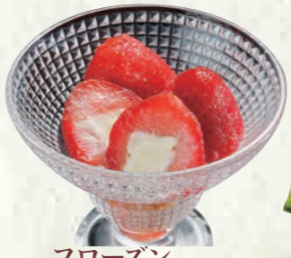
フローズンいちごミルク 200円