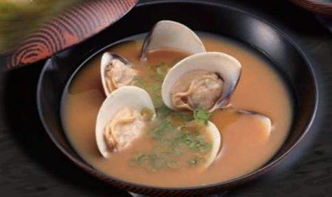
あさりのお味噌汁 150円