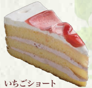
いちごショートケーキ 280円