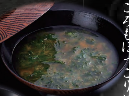
あおさのお味噌汁 150円