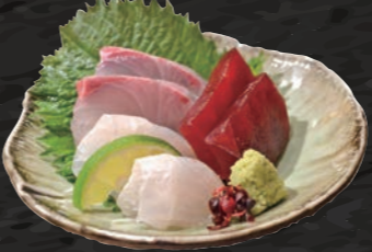
本日のお造り三点盛り 480円