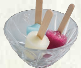
ミニアイスキャンディー (バニラ・グレープ・ソーダのセット) 100円