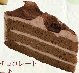
生チョコレートケーキ 280円