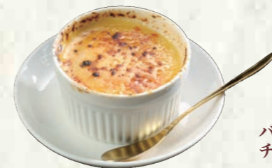
アイスクリームブリュレ 200円