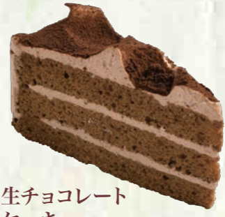
生チョコレートケーキ 280円