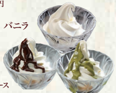
濃厚ソフトクリーム〈グラス〉 150円