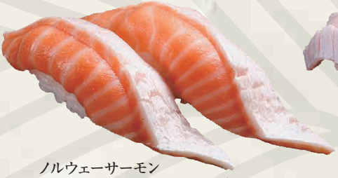
ノルウェーサーモン