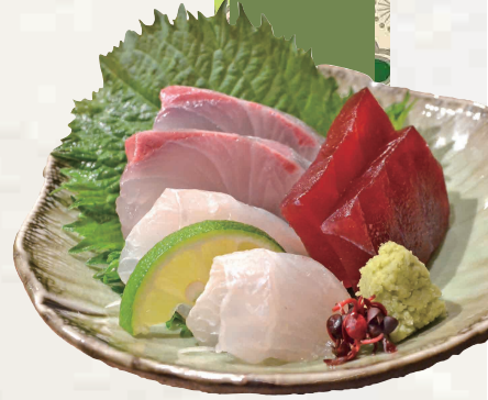
本日のお造り三点盛り (イメージ)