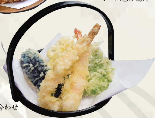
天ぷら盛り合わせ