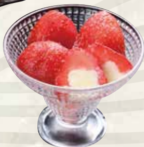
いちごミルクアイス