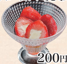
フローズンいちごミルク