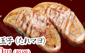
炙り玉子(たれマヨ) 100円(税別)