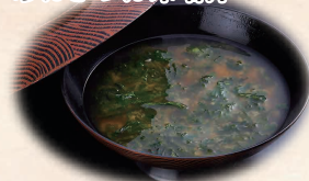
あおさのお味噌汁