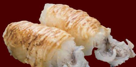
炙り姿やりのいかたれマヨ 150円(税別)