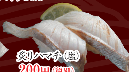
炙りハマチ(塩) 200円(税別)