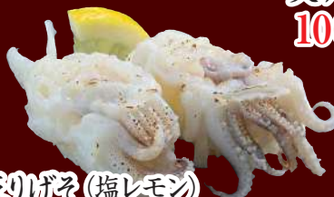
炙りげそ(塩レモン) 100円(税別)