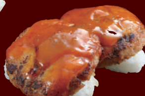
炙りハンバーグカレー 100円(税別)