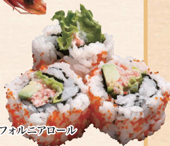
カリフォルニアロール