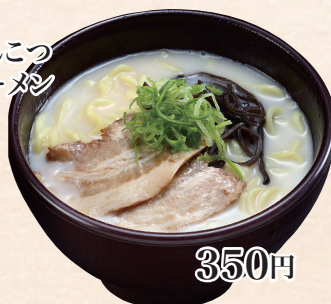
とんこつ ラーメン