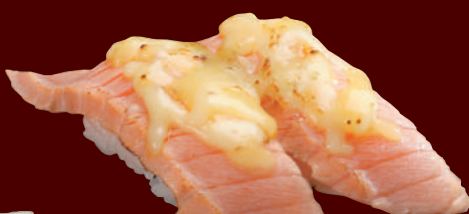
炙りサーモンチーズ 100円(税別)