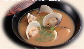
あさりのお味噌汁