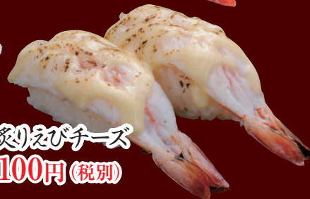
炙りえびチーズ 100円(税別)