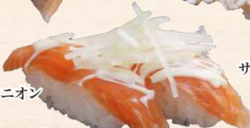
サーモンオニオン