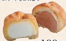
シューアイス バニラ・チョコの2つ