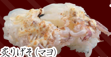
炙りげそ(マヨ) 100円(税別)