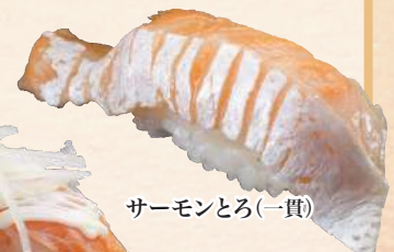
サーモンとろ(一貫)