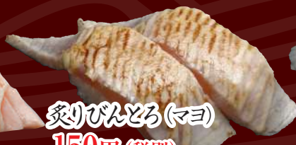
炙りびんとろ(マヨ) 150円(税別)