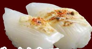
炙りいか七味マヨ 100円(税別)