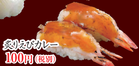
炙りえびカレー 100円(税別)