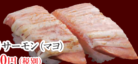
炙りサーモン(マヨ) 100円(税別)