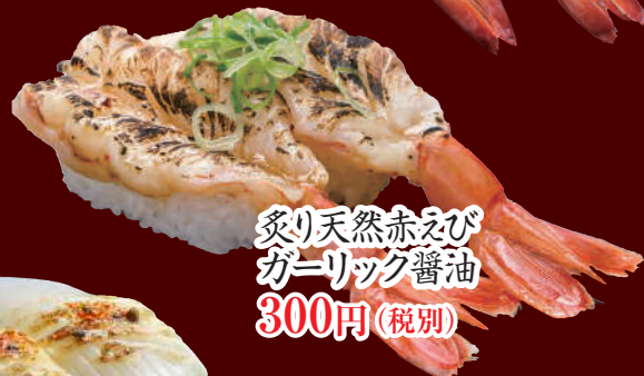
炙り天然赤えび ガーリック醤油 300円(税別)