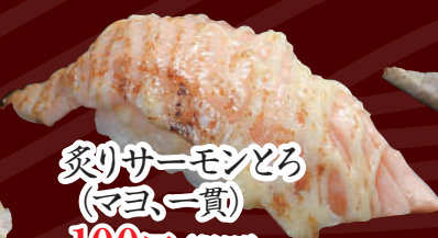
炙りサーモンとろ (マヨ一貫) 100円(税別)