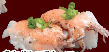
炙りげその明太マヨ 100円(税別)