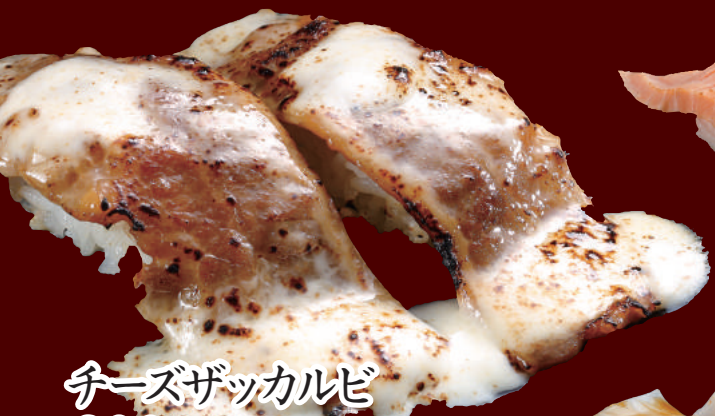
チーズザッカルビ 300円(税別)