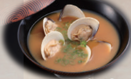
あさりのお味噌汁