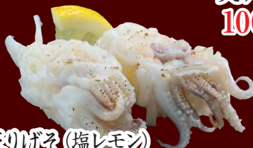
炙りげそ(塩レモン) 100円(税別)