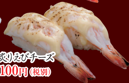
炙りえびチーズ 100円(税別)