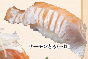
サーモンとろ(一貫)