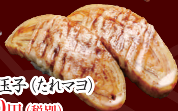
炙り玉子(たれマヨ) 100円(税別)