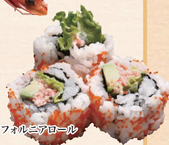
カリフォルニアロール