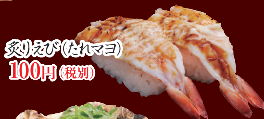
炙りえび(たれマヨ) 100円(税別)