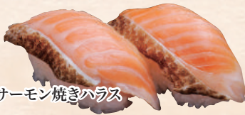
サーモン焼きハラス