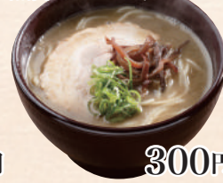
魚介とんこつラーメン