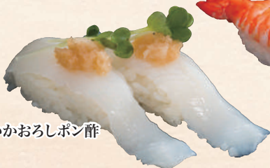
上いかおろしボン酢