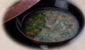
あおさのお味噌汁