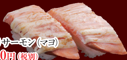
炙りサーモン(マヨ) 100円(税別)