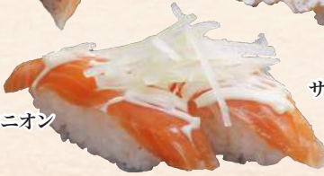
サーモンオニオン