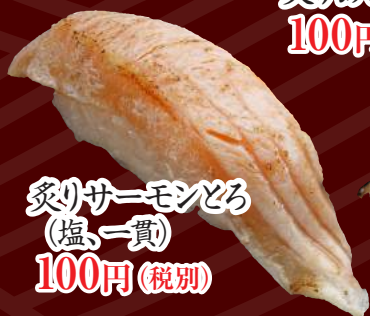
炙りサーモンとろ (塩一貫) 100円(税別)