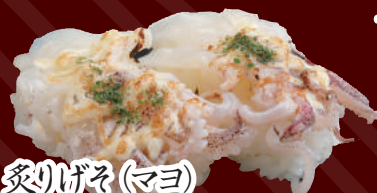
炙りげそ(マヨ) 100円(税別)