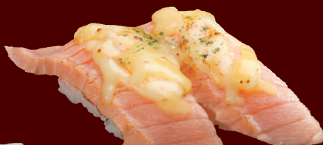
炙りサーモンチーズ 100円(税別)