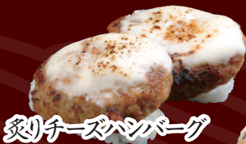
炙りチーズハンバーグ 100円(税別)