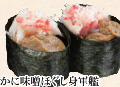
かに味噌ほぐし身軍艦