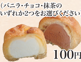
シューアイス (バニラ・チョコ・抹茶の いずれか2つをお選びください)