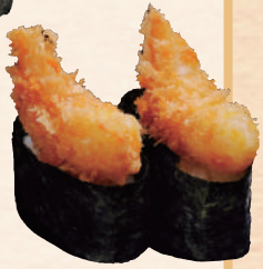
さくさくエビフライ軍艦