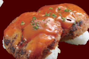
炙りハンバーグカレー 100円(税別)