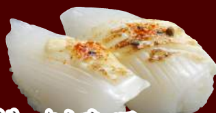
炙りいか七味マヨ 100円(税別)