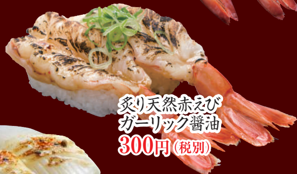
炙り天然赤えび ガーリック醤油 300円(税別)