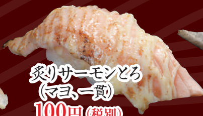
炙りサーモンとろ (マヨ一貫) 100円(税別)