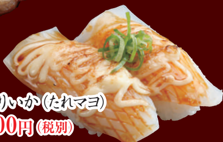
炙りいか(たれマヨ) 100円(税別)