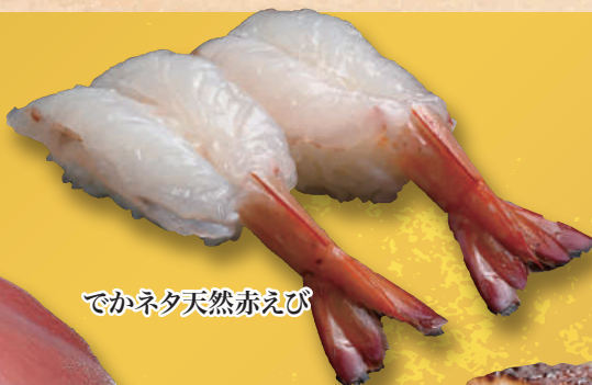
でかネタ天然赤えび