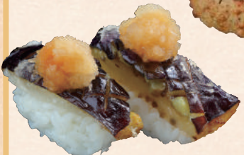
揚げなすおろしポン酢