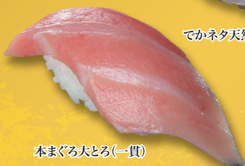
本まぐろ大とろ(一貫)