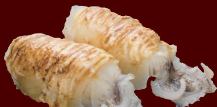
炙り姿やりのいかたれマヨ 150円(税別)