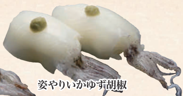
姿やりのいかゆず胡椒