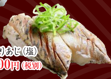
炙りあじ(塩) 100円(税別)