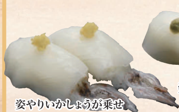
姿やりのいかしろうが乗せ