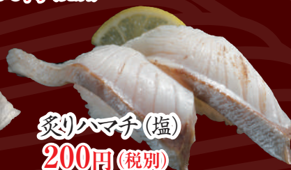
炙りハマチ(塩) 200円(税別)