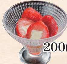
フローズンいちごミルク