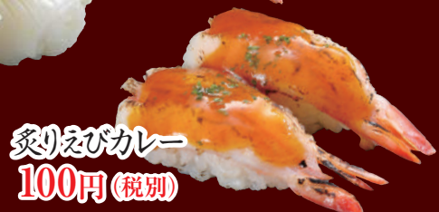
炙りえびカレー 100円(税別)