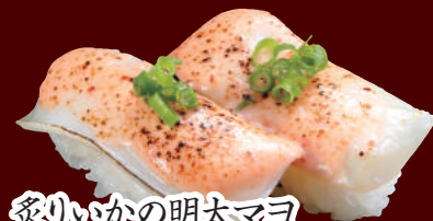
炙りいかの明太マヨ 100円(税別)