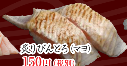
炙りびんとろ(マヨ) 150円(税別)