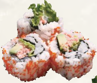
カリフォルニアロール