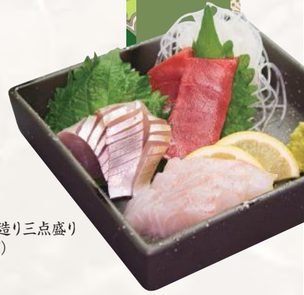
本日のお造り三点盛り (イメージ)