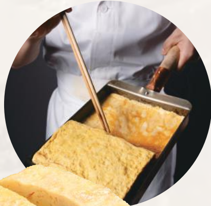
独自の出汁で 仕上げた 自家製だし巻き