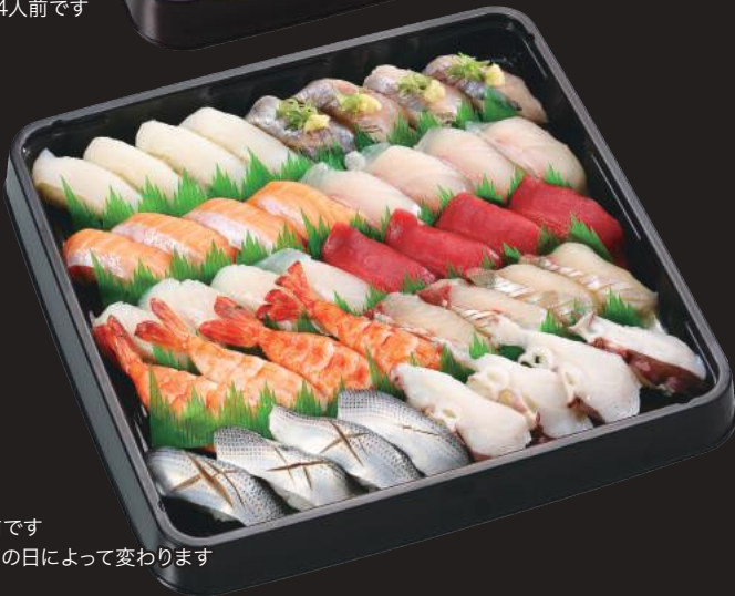
※写真は4人前です ※鮮魚5品はその日によって変わります

本まぐろ赤身、いか、生えび、かんぱち、 ノルウェーサーモン、うなぎ、真鯛、えんがわ、玉子、いくら