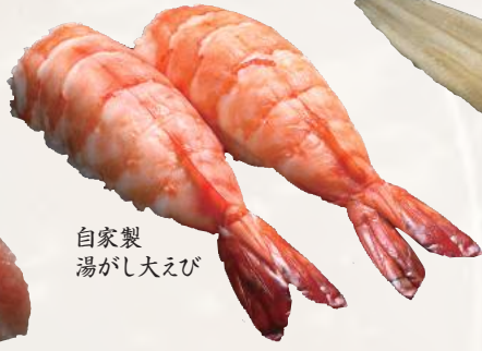
自家製湯がし大えび