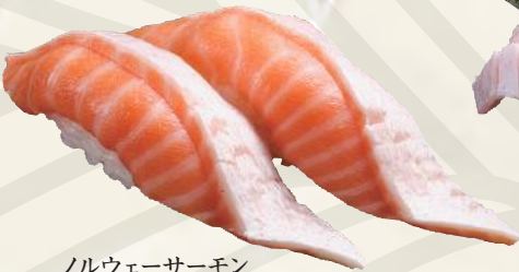
ノルウェーサーモン