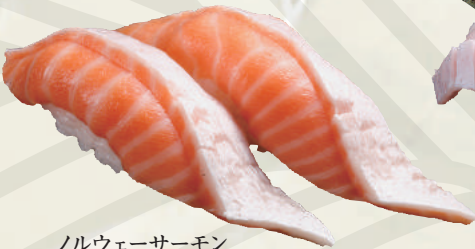
ノルウェーサーモン