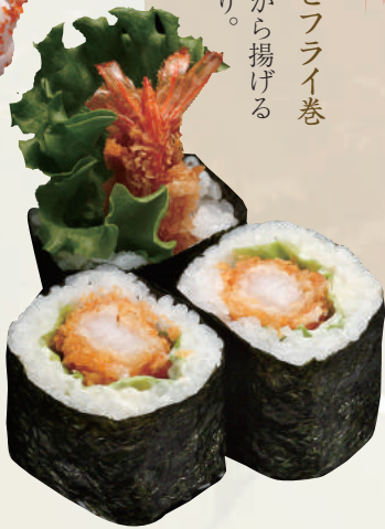
カリフォルニアロール