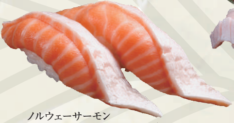
ノルウェーサーモン