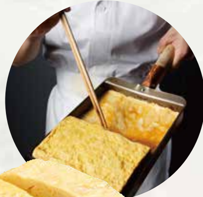
独自の出汁で 仕上げた 自家製だし巻き