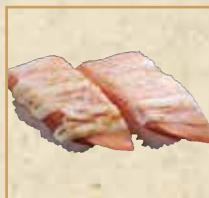
炙りサーモン(マヨ) Seared Salmon with Mayonnaise 炙烧蛋黄酱三文鱼 握寿司