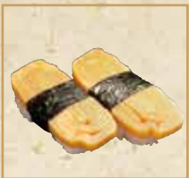
玉子 Japanese Style chunky Omelet 鸡蛋卷 握寿司