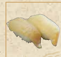
ひらめの昆布締め Kombu Sandwiched Flounder 比目鱼昆布缔握寿司