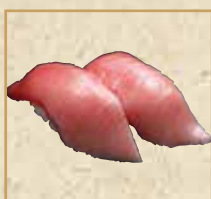
本まぐろ中とろ Medium Fatty Pacific Bluefin Tuna 蓝鳍金枪鱼中脂握寿司