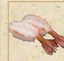
赤えび Red Shrimp 红虾握寿司