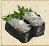
生しらす軍艦 Raw whitebait Gunkan 鲜银鱼军舰卷