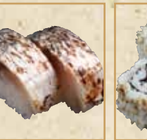
焼きば押し寿司 Grilled Mackerel Pressed Sushi 烤鲭鱼寿司