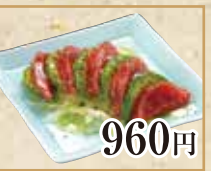
960円 本まぐろとアボカドの カルパッチョ Tuna and avocado carpaccio 金枪鱼和鳄梨薄片