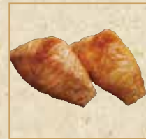
いなり Sweet Beancurd Gunkan 甜豆皮寿司