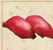
本まぐろ赤身 Bluefin Tuna 蓝鳍金枪鱼握寿司