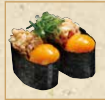
月見納豆軍艦 Tsukimi Natto Gunkan 蛋黄纳豆军舰卷