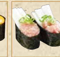
月見ねぎとろ軍艦 Tsukimi Negitoro Gunkan 月见金枪鱼肉糜军舰 ねぎとろ山芋軍艦 Negitoro and Yam Gunkan 葱花山药金枪鱼泥军舰卷