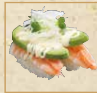
えびアボカド Shrimp and Avocado 鲜虾鳄梨握寿司