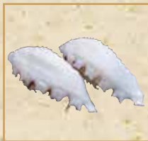
たこ Octopus 章鱼 握寿司