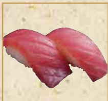
まぐろ Tuna 金枪鱼 握寿司