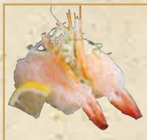
生えびのレモン塩 Raw Shrimp with Lemon and Salt 盐味柠檬鲜虾 握寿司