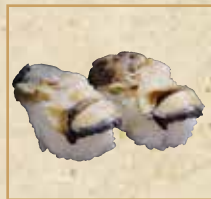
にし貝 Spiral Shellfish 海螺 握寿司