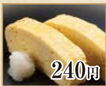
240円 だし巻き玉子 Rolled Omelet 汤汁鸡蛋卷