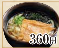
360円 きつねうどん Kitsune Udon Noodles 炸豆腐乌冬面