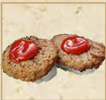
ハンバーグ Hamburger 牛肉饼 握寿司