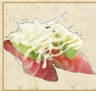
まぐろアボカド Tuna and Avocado 牛油果金枪鱼 握寿司