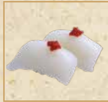
いかの柚子胡椒 Squid with Yuzu Pepper 柚子胡椒味乌贼 握寿司