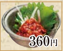
360円 チャンジャ Spicy Cod Innards 辣拌鳕鱼内脏