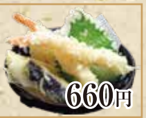
660円 天ぷら盛り合わせ Assorted tempura 天妇罗拼盘