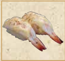
炙りえび(マヨ) Seared Shrimp with Mayonnaise 炙烤虾蛋黄酱 握寿司