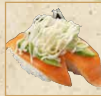
サーモンアボカド Salmon and Avocado 牛油果三文鱼握寿司