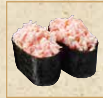
カニ風味サラダ Clab Salad Gunkan 螃蟹沙拉卷