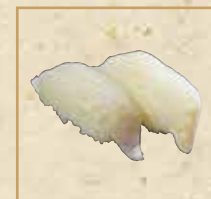
ひらめ Flounder 比目鱼握寿司