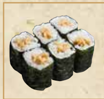
納豆細巻 Natto Thin Roll 纳豆小卷