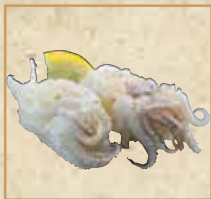
炙りげそ(岩塩) Seared Squid Arms with Salt 炙烧盐味鱿鱼须 握寿司