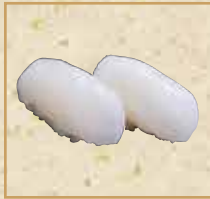
いか Squid 乌贼握寿司