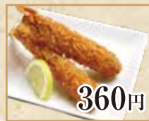
360円 エビフライ Fried Shrimp 炸虾