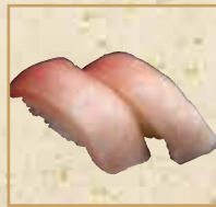
びんとろ Fatty Albacore Tuna 长鳍金枪鱼脂 握寿司