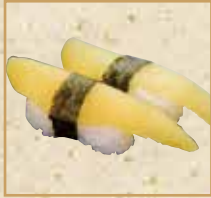
数の子 Herring roe 鲱鱼子握寿司