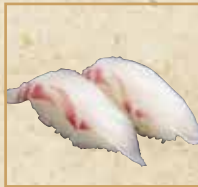
真鯛 Red Sea Bream 加吉鱼握寿司