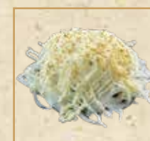
オニオンドーム サーモン Salmon with Onion dome 洋葱圆顶三文鱼握寿司