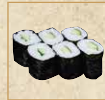
かっぱ巻 Cucumber Roll 河童卷