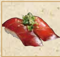
まぐろの漬け Marinated Tuna 酱油渍金枪鱼 握寿司