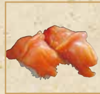
赤貝 Whelk 海螺握寿司