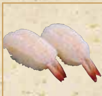
生えび Raw Shrimp 鲜虾 握寿司