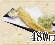
480円 穴子一本天ぷら Sea Eel Tempura 天妇罗海鳗