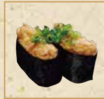
納豆軍艦 Natto Gunkan 納豆军舰卷