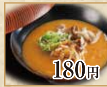
180円 きのこのお味噌汁 Mushroom Miso Soup 蘑菇味噌汤