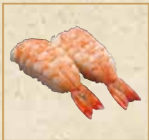
朝茹でえび Boiled shrimp in the morning 早上煮虾 握寿司