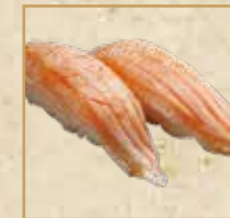
ノルウェーサーモン 岩塩炙り Seared Norway Salmon with Salt 炙烧盐味 挪威三文鱼握寿司