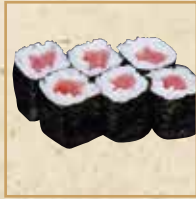
鉄火巻 Tekka Roll 铁火卷