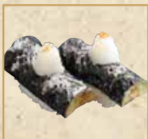
揚げなす Fried Eggplant 油炸茄子 握寿司