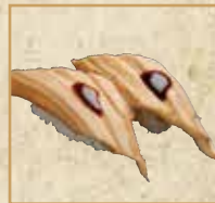
煮穴子 Boiled Conger Eel 煮鳎鱼握寿司