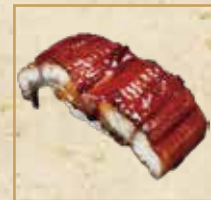
厚切りうなぎ(一貫) Thick cut eel [1pc] 厚切鳗鱼 (1个)握寿司