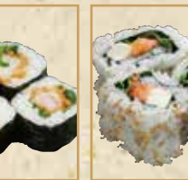
エビフライ巻 Crispy Fried Shrimp Roll 松脆油炸大虾卷