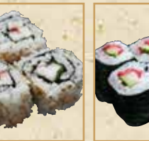
山芋梅しそ巻 Yam and Umeshiso Roll 山药梅紫苏卷握寿司