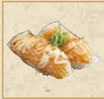
炙りいか(たれマヨ) Seared Squid with Sauce and Mayonnaise 炙烤蛋黄甜酱 乌贼鱼 握寿司