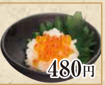
480円 おろしくら Salmon Roe with Grated Daikon Radish 萝卜泥三文鱼籽