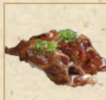
牛カルビ Marinated short rib 五花肉握寿司