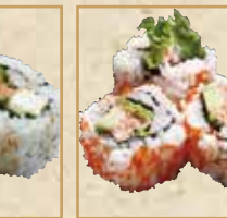
サーモンクリーム チーズロール Salmon and Cream Cheese Roll 三文鱼奶油奶酪卷