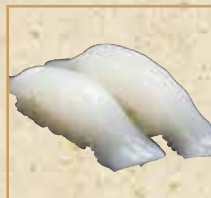
上いか Superior Squid 上等乌贼 握寿司