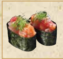
海鮮ユッケ Seafood Yukhoe Gunkan 海鲜脍卷