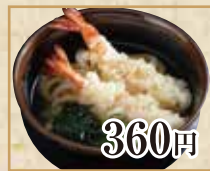
360円 天ぷらうどん Tempura Udon Noodles 天妇罗乌冬面