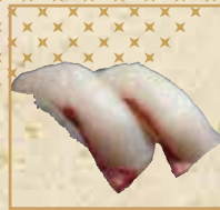
かんぱち Amberjack 间八鱼握寿司