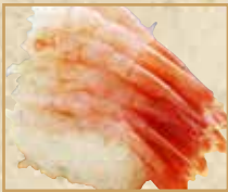
甘えび限界盛り Northern Shrimp 甜虾握寿司