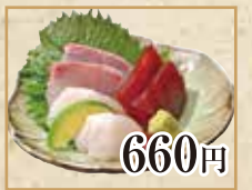
660円 本日のお造り Sashimi 生鱼片