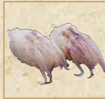
いかげそ Squid Arms 鱿鱼须 握寿司