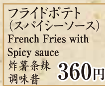
360円 フライドポテト (スパイシーソース) French Fries with Spicy sauce 炸薯条辣 调味酱