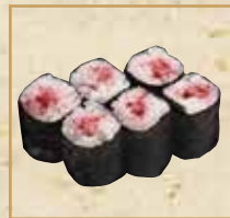
梅しそ巻 Umeshiso Roll 梅紫苏卷