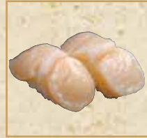
ほたて Raw Scallop 鲜扇贝握寿司