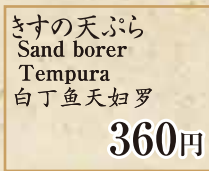
360円 きすの天ぷら Sand borer Tempura 白丁鱼天妇罗