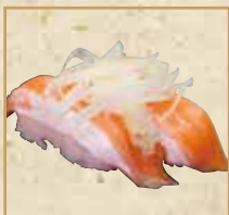
オニオンサーモン Salmon with Onion 洋葱三文鱼 握寿司