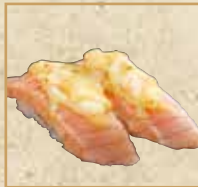
炙りサーモン チーズ Seared Salmon with Cheese 炙烧奶酪三文鱼握寿司