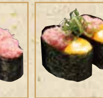
ねぎとろ軍艦 Negitoro Gunkan 金枪鱼肉糜军舰