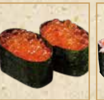
いくら軍艦 Salmon Roe Gunkan 生鲑鱼军舰卷