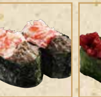
ずわいがにの ほぐし身軍艦 Snow Crab Gunkan 雪蟹黄蟹肉碎军舰卷