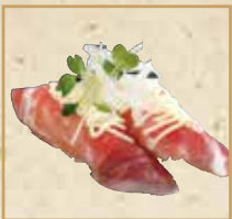
生ハムオニオン Prosciutto with Onion 洋葱生火腿 握寿司