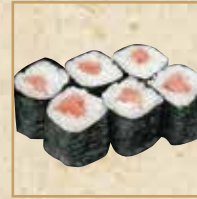
とろ鉄火 Tuna Filled Roll 金枪鱼铁火卷

本まぐろ大どろ 軍艦 Extra Fatty Pacific Bluefin Tuna Gunkan 蓝鳍金枪鱼大脂 军舰卷