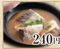
240円 あら汁 Fish Scraps Miso Soup 鱼骨酱汤