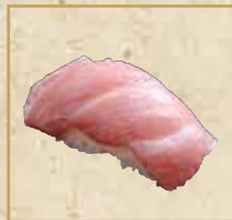
本まぐろ大とろ(一貫) Extra Fatty Pacific Bluefin Tuna [1pc] 蓝鳍金枪鱼大脂 (1个)握寿司