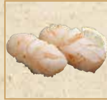
炙りほたて岩塩 Seared Scallop with Salt 炙烧盐味 扇贝握寿司