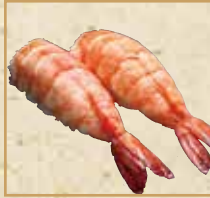
自家製湯がし大えび Home-boiled Big Shrimp 自家特制白灼大虾握寿司