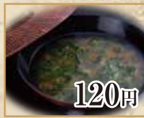
120円 あおさのお味噌汁 Seaweed Miso Soup 青海菜酱汤