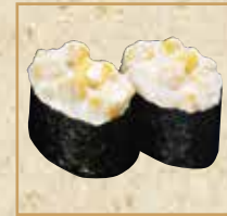
コーン軍艦 Corn Gunkan 玉米军舰卷