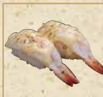
炙りえびチーズ Seared Shrimp with Cheese 炙烧奶酪虾 握寿司