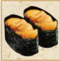
うに Sea urchin 海胆 军舰卷