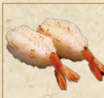
赤えび岩塩炙り Seared Red Shrimp with Salt 炙烧盐味红虾握寿司