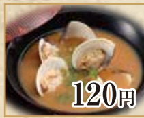
120円 あさりのお味噌汁 Little Neck Clam Miso Soup 蛤仔味噌汤