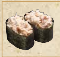
ツナサラダ Tsunasarada 金枪鱼沙拉