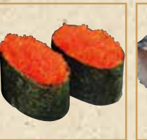
とびっこ軍艦 Fying Fsh Roe Gunkan 飞鱼籽军舰卷