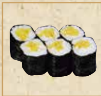
しんこ巻 Pickles Radish Roll 新香卷