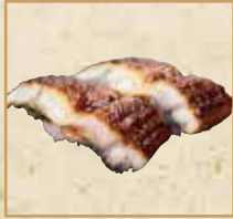
うなぎ Eel 鳗鱼握寿司