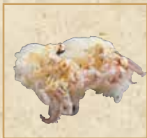
炙りげそ(マヨ) Seared Squid Arms with Mayonnaise 炙烧蛋黄酱鱿鱼须 握寿司