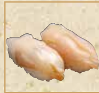
つぶ貝 Ark Shell 海蛤握寿司