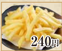
240円 フライドポテト French Fries 炸薯条