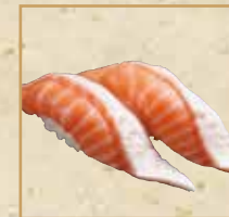
ノルウェーサーモン Norway Salmon 挪威三文鱼握寿司