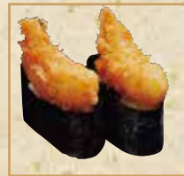
エビフライ軍艦 Crispy Fried Shrimp Gunkan 炸虾军舰卷