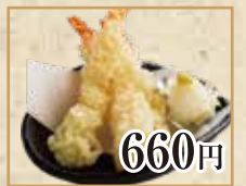
660円 えびの天ぷら Shrimp Tempura 天妇罗炸虾