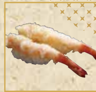
えび天握り Tempura Shrimp 鲜虾天妇罗寿司