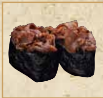
牛肉しぐれ軍艦 Beef Shigure Gunkan 牛肉碎军舰卷