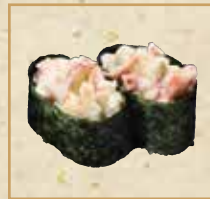
ほっき貝サラダ Surf Clam Salad Roll 鸟贝沙拉卷