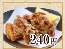
240円 鶏の唐揚げ Fried Chicken 炸鸡块