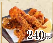
240円 げその唐揚げ Fried Squid Tentacles 油炸鱿鱼须