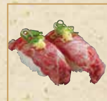
馬刺し Horse Meat Sashimi 马肉刺身握寿司