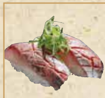
あじ Horse Mackerel 鲹鱼 握寿司