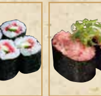
梅きゅう細巻 Cucumber and Ume Roll 梅子黄瓜卷