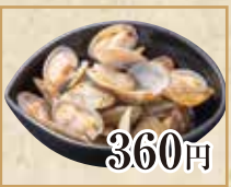
360円 あさりの酒蒸し Sake Steamed Clam 酒蒸文蛤