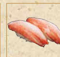
ずわい蟹 Snow Crab 雪蟹握寿司