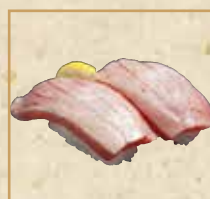
炙りとろ(岩塩) Seared Medium Fatty Pacific Bluefin Tuna with Salt 炙烧盐味蓝鳍金枪鱼 中脂握寿司