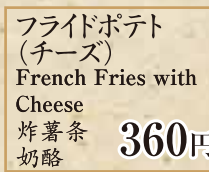
360円 フライドポテト (チーズ) French Fries with Cheese 炸薯条 奶酪