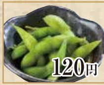
120円 枝豆 Edamame 毛豆