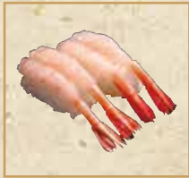
甘えび Northern Shrimp 甜虾 握寿司