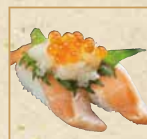
ノルウェーサーモン いくら乗せ Norway Salmon with Salmon Roe 生鲑鱼挪威三文鱼 握寿司