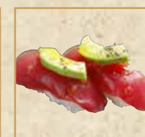
本まぐろアボカド Bluefin Tuna and Avocado 牛油果蓝鳍金枪鱼 握寿司