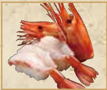
ぼたんえび Button shrimp 纽扣虾握寿司