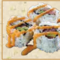
スパイシーツナ ロール Spicy Tuna Roll 香辣金枪鱼卷

本まぐろ大どろ 軍艦 Extra Fatty Pacific Bluefin Tuna Gunkan 蓝鳍金枪鱼大脂 军舰卷