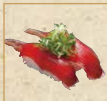
かつおのたたき Seared Bonito 半生鲣鱼片 握寿司