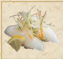
いかのレモン塩 Squid with Lemon and Salt 盐味柠檬鱿鱼 握寿司