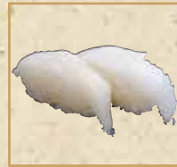
えんがわ Flounder Muscle 比目鱼缘侧握寿司