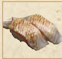
炙りびんとろ(マヨ) Seared Fatty Albacore Tuna 炙烧蛋黄酱长鳍 金枪鱼脂握寿司