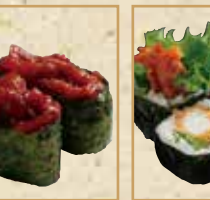
チャンジャ軍艦 Spicy Cod Innards Gunkan 辣拌鳕鱼内脏 军舰卷