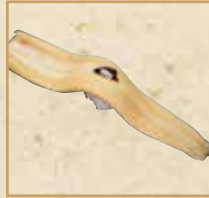
煮穴子一本握り Boiled Conger Eel[1pc] 煮鳎鱼(一个)握寿司