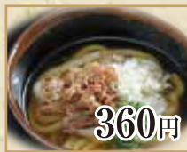
360円 肉うどん Beef Udon 牛肉乌冬面