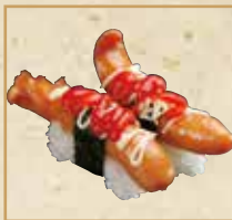
ウインナー Vienna Sausage 维也纳香肠 握寿司