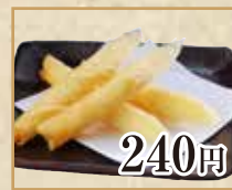
240円 チーズスティック Cheese Sticks 奶酪棒